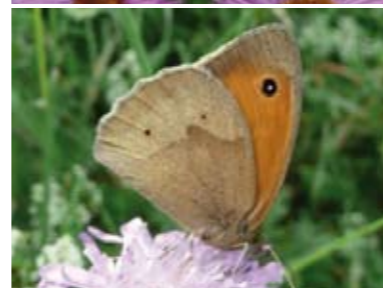
[14] Großes Ochsenauge Maniola jurtina