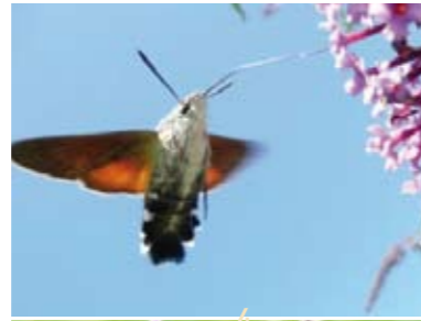
[26] Taubenschwänzchen Macroglossum stellatarum Weibchen (Unterseite)