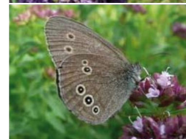
[20] Schornsteinfeger Aphantopus hyperantus (Unterseite)