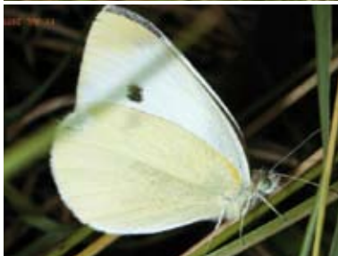
[3] Kleiner Kohl-Weißling Pieris rapae Weibchen (Unterseite)