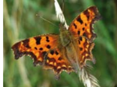
[7] C-Falter Nymphalis c-album (Oberseite)