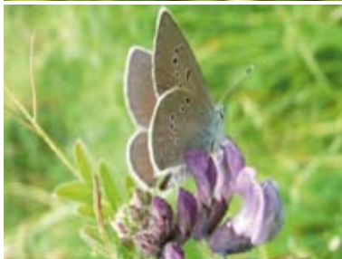
[23] Rotklee-Bläuling Polyommatus semiargus Weibchen (Unterseite)