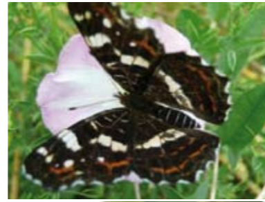
[11] Landkärtchen Sommer Araschnia levana 2.Generation (Oberseite)