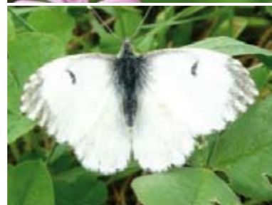
[9] Aurorafalter Anthocharis cardamines Weibchen (Oberseite)