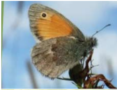
[21] Kleines Wiesenvögelchen Coenonympha pamphilus (Unterseite)