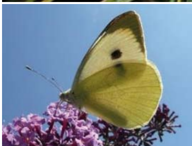
[4] Großer Kohl-Weißling Pieris brassicae Weibchen