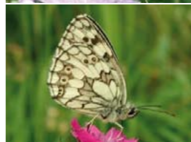
[15] Schachbrett Melanargia galathea (Unterseite)