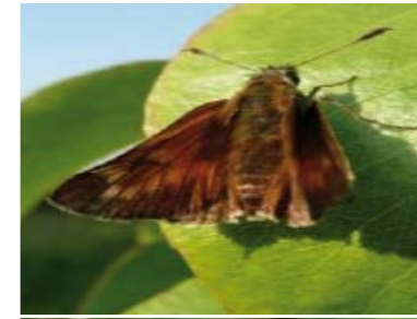
[16] Rostfarbiger Dickkopffalter Ochloides sylvanus (Oberseite)