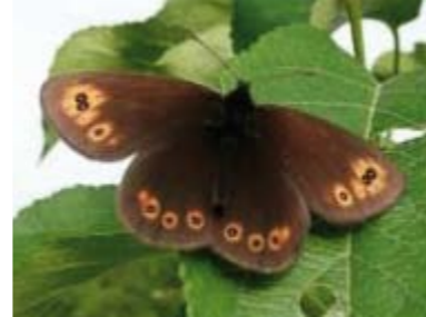
[12] Rundaugen- Mohrenfalter Erebia medusa (Oberseite)