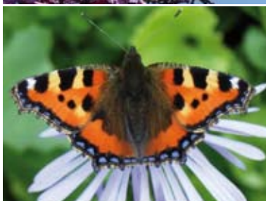
[5] Kleiner Fuchs Aglais urticae (Oberseite)