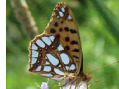
[17] Kleiner Perlmutterfalter Issoria lathonia (Unterseite)