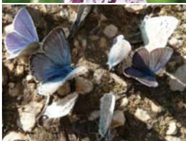
[25] Bläulings- versammlung zur Mineralsalzaufnahme