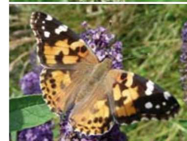
[19] Distelfalter Vanessa cardui (Oberseite)