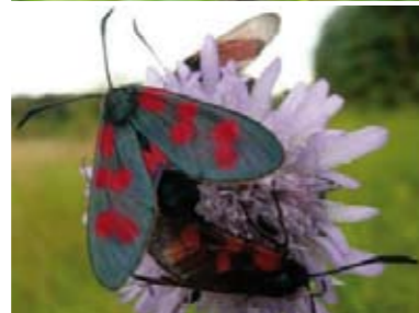
[28] Sechsfleck-Widderchen Zygaena filipendulae (Oberseite)