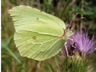
[2] Zitronenfalter Gonepteryx rhamni Männchen (Unterseite)