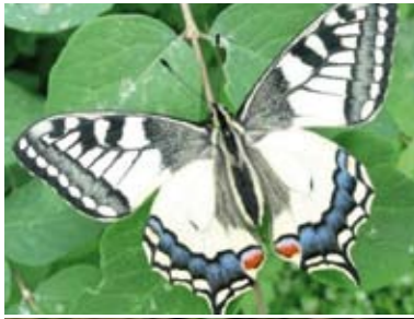
[1] Schwalbenschwanz Papilio machaon (Oberseite)