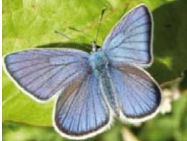
[22] Hauhechel-Bläuling Polyommatus icarus (Oberseite)