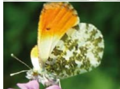
[8] Aurorafalter Anthocharis cardamines Männchen (Unterseite)