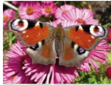
[6] Tagpfauenauge Nymphalis io (Oberseite)