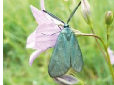
[27] Grünwiderchen Adscita geryon (Oberseite)