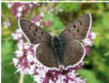
[24] Brauner Feuerfalter Lycaena tityrus Männchen (Oberseite)