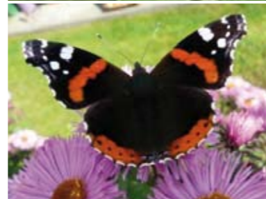
[13] Admiral Vanessa atalanta (Oberseite)