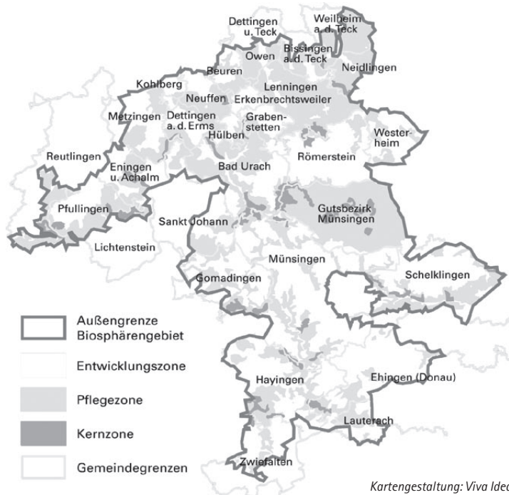
Kartengestaltung: Viva Idea

Die Hang- und Schluchtwälder am Albtrauf sind ein markantes naturräumliches Alleinstellungsmerkmal. Aber auch die landschaftsprägenden Streuobstwiesen im Albvorland und die abwechslungsreiche, traditionelle Kulturlandschaft auf der Schwäbischen Alb mit ihren Wacholderheiden kennzeichnen das Biosphärengebiet. Ein wichtiger Bestandteil ist der ehemalige Truppenübungsplatz Münsingen, der zentral in der Gebietskulisse liegt. Die Nähe zum Ballungsraum Stuttgart macht das Biosphärengebiet zum wertvollen Naherholungsgebiet. Es gibt vielerorts traditionsreiche Feste und Hockete. Diese sowie neue Events z.B. im Bereich Sport und Regionalvermarktung werden auch dank des Labels „UNESCO-Biosphärenreservat“ und dank professioneller Werbung attraktiver – mit positiven wie negativen Folgen für Bevölkerung und Natur.