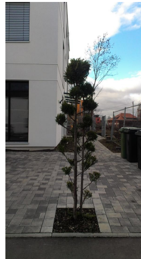
... "Betongrün" ersetzt Obstbäume

Außerdem kommt es immer wieder vor, dass selbst laut Bebauungsplan zu erhaltende Bäume vom Bauträger gefällt wurden und dies von der zuständigen Aufsichtsbehörde aufgrund von Personalmangel (?) weder kontrolliert noch geahndet wurde. Auch da ist es wichtig, dass sich BürgerInnen (gern in Kooperation mit den örtlichen Naturschutzverbänden) die Planungen frühzeitig anschauen und bei Behörden bzw. Bauträger nachfragen, ob gesichert ist, dass der Baum bzw. das Gehölz nicht "unter den Bagger" gerät.