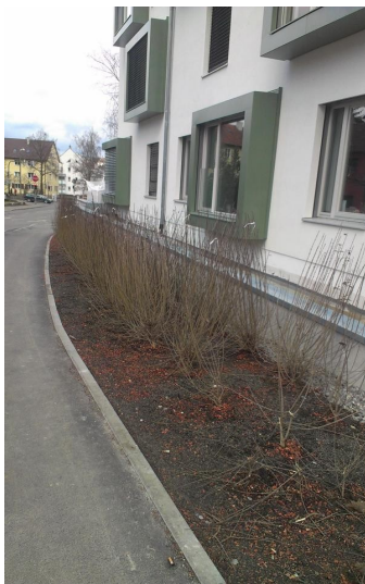
Beispiele für Ersatzpflanzungen: „Monohecke“

Bei (vermuteter bzw. nachgewiesener) Verkehrsgefährdung zählen allerdings Menschen mehr als z. B. Fledermäuse - dann kann man zumindest frühzeitige adäquate Ersatz-/ Ausgleichsmaßnahmen fordern.