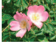
Wildrose 6 - 8