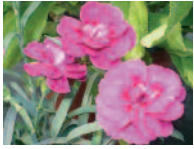
Kartäusernelken 6 - 9