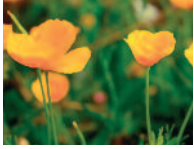
kalifornischer Mohn 6 - 11