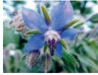
Borretsch 6 - 9