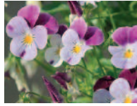
wild. Stiefmütter. 4 - 7