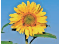
Sonnenblume 6 - 8