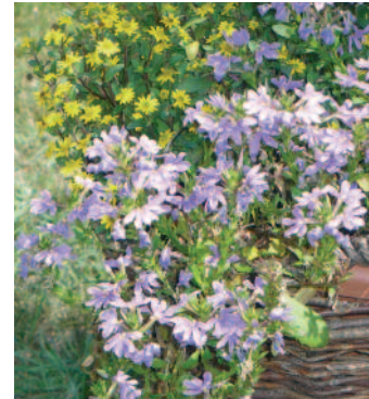
Kräuterpark Bad Rip.-Sap