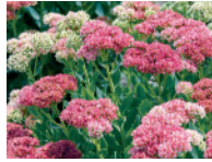
Fetthenne 6 - 9