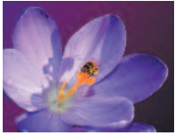
Honigkrokus 3 - 5