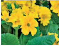
Primel 3, 4