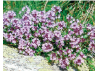
Thymian 5 - 10