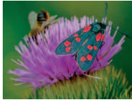
wilde Distel 6 - 8