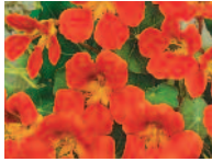
Kapuzienkresse 7 - 9