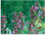
Salbei 6 - 9