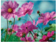
Cosmea 8 - 11