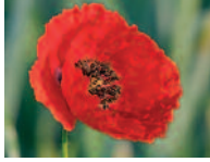
Mohn 5, 6