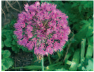
Schmucklauch 5 - 8