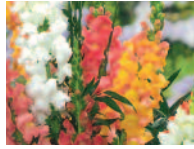
Löwenmäulchen 6 - 9