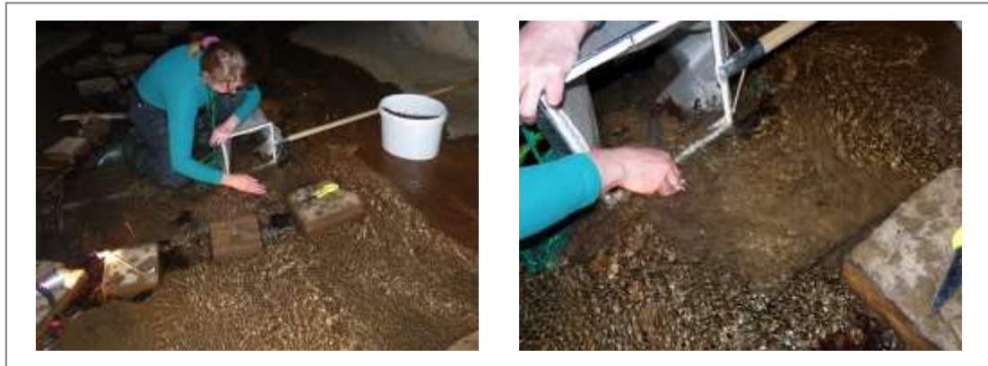
Abbildung 5: Beprobung des Erlenbachs.

Im Dezember 2011 wurden zwei Textilproben vom Institut für Textil- und Verfahrenstechnik der Deutschen Institute für Textil- und Faserforschung Denkendorf auf Reißfestigkeit überprüft. Das erste Stück war unbenutzt, das zweite nach einem Jahr im Gewässer entfernt worden.