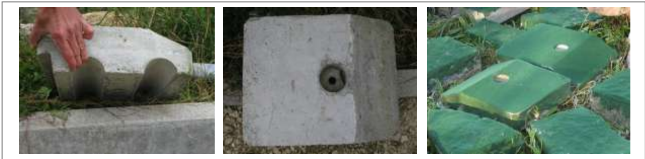
Abbildung 2: Betonstein mit zur Strömung hin abgeflachter Seite, Hohlräume als Unterstand und Vertiefung zum Einschrauben der Mutter (links und Mitte). Beflockte Störsteine (rechts).

Dieser Stein ist als Gebrauchsmuster beim Patentamt angemeldet.