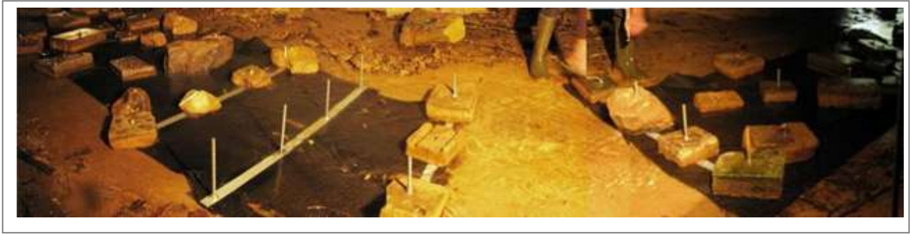
Abbildung 3: Beprobungsstelle im Erlenbach. Am linken und rechten Bildrand sind die Störsteine auf dem eingebrachten Textil zu erkennen. Links Die Gewebe-Beprobungsstellen ohne Störsteine, daneben die Vergleichsstelle ohne Textil oder Steine.

Beide Bäche wurden mehrfach mit einer WTW Multiparameter Sonde (WTW Multi Handgerät 350i mit WTW MPP 350 Multielektrode, WTW, Weilheim, Deutschland) beprobt (Abbildung 4). Dabei wurden die folgenden Parameter bestimmt: Temperatur, Sauerstoff, pH, Leitfähigkeit (Tabelle 1).