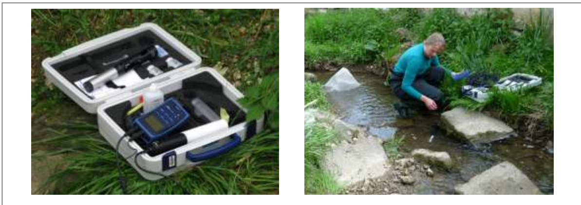
Abbildung 4: WTW Multiparameter Sonde (WTW Multi Handgerät 350i mit WTW MPP 350 Multielektrode, WTW, Weilheim Germany), Leihgabe der Abteilung Zoologie, Universität Stuttgart (links). Messproben am Erlenbach (rechts)

Beide Bäche wurden mehrfach mit einer WTW Multiparameter Sonde (WTW Multi Handgerät 350i mit WTW MPP 350 Multielektrode, WTW, Weilheim, Deutschland) beprobt (Abbildung 4). Dabei wurden die folgenden Parameter bestimmt: Temperatur, Sauerstoff, pH, Leitfähigkeit (Tabelle 1).