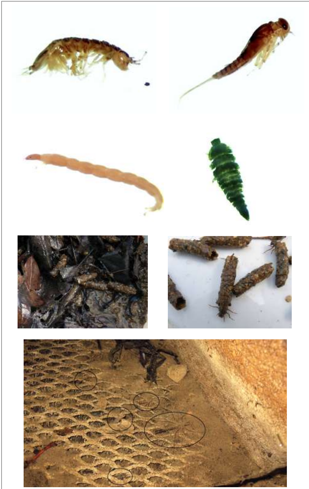
Abbildung 9: Beispiele aquatischer Organismen aus dem Erlenbach, April und Oktober 2011. Von oben links: Wasserassel, Eintagsfliegenlarve, Zuckmückenlarve, Hakenkäferlarve, Köcherfliegenlarve (in der Detritusprobe und separat) sowie u.a. Libellenlarven (großer Kreis unteres Bild).