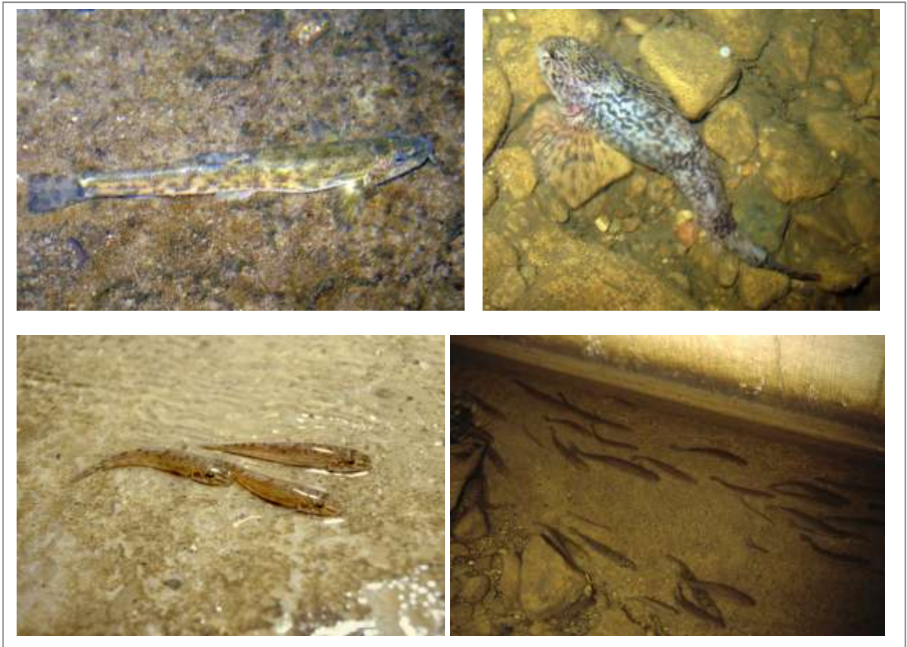
Abbildung 10: Beispiele der Fische die bei den unterschiedlichen Begehungen am Erlenbach beobachtet wurden: (von oben links) Schmerle, Groppe, Gründling, Döbel und Hasel.

Bei verschiedenen Begehungen wurde eine Vielzahl an Kleinfischen in den Verdolungen beobachtet. Vor allem, Bachschmerlen ( Barbatula barbatula ), Groppen ( Cottus sp.) Döbel ( Leuciscus cephalus ), Hasel ( Leuciscus leuciscus ), Schneider ( Alburnoides bipunctatus ) Elritzen ( Phoxinus phoxinus ) und Gründlinge ( Gobio gobio ) (Abbildung 10). Doch es wurden auch Bachforellen ( Salmo trutta ), Flussbarsche ( Perca fluviatilis ) und der Dreistachliger Stichling ( Gasterosteus aculeatus ) gesehen sowie gebietsfremde Arten wie Sonnenbarsche ( Lepomis gibbosus ).