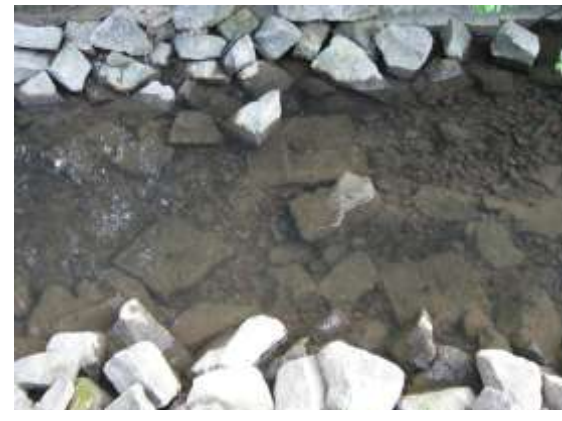
Arbeitsschritte am Reichenbach