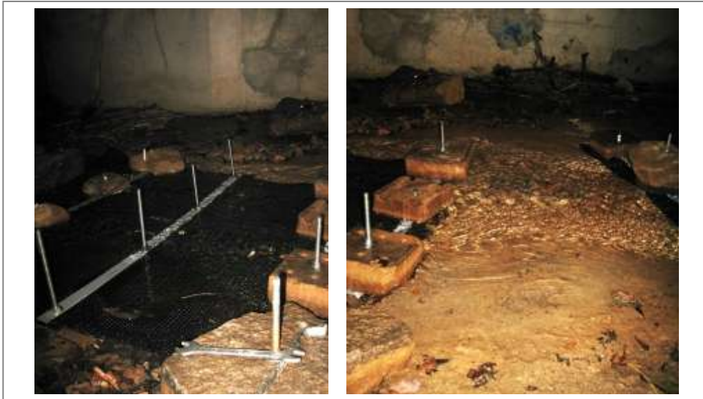
Abbildung 7: Beprobungsstelle in der Verdolung im Erlenbach, April 2011. Links der Beprobungsabschnitt mit Abstandsgewebe, rechts der Vergleichsabschnitt ohne Textil und ohne Störsteine.

Bereits in den ersten Begehungen des Erlenbachs konnten unter dem Gewebe Sedimentablagerungen entdeckt werden. Der benachbarte Vergleichsabschnitt hatte keine Ablagerungen und keinen Bewuchs aufzuweisen (Abbildung 7). Bei der Probenahme im April 2011 wurde unter dem 30 cm x 30 cm großen Textilstück, 0,75 l Sediment verschiedener Korngrößen und Detritus gesammelt (Abbildung 8).