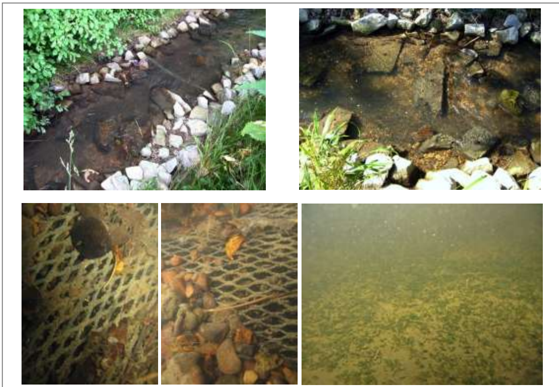
Abbildung 6: Projektbach Reichenbach. Oben von links nach rechts: der zur Beprobung vorgesehene Bachabschnitt, nur noch kleine Bereiche des Textils liegen frei. Unten von links nach rechts: Die meisten

Wie bereits oben beschrieben, war die Sedimentation im Reichenbach so stark, dass das Gewebe bereits wenige Monate nach Einbringung nur noch an wenigen Stellen sichtbar war. Kies und kleinere Steine waren hier vorwiegend vorhanden, Feinsediment weniger (Abbildung 6).