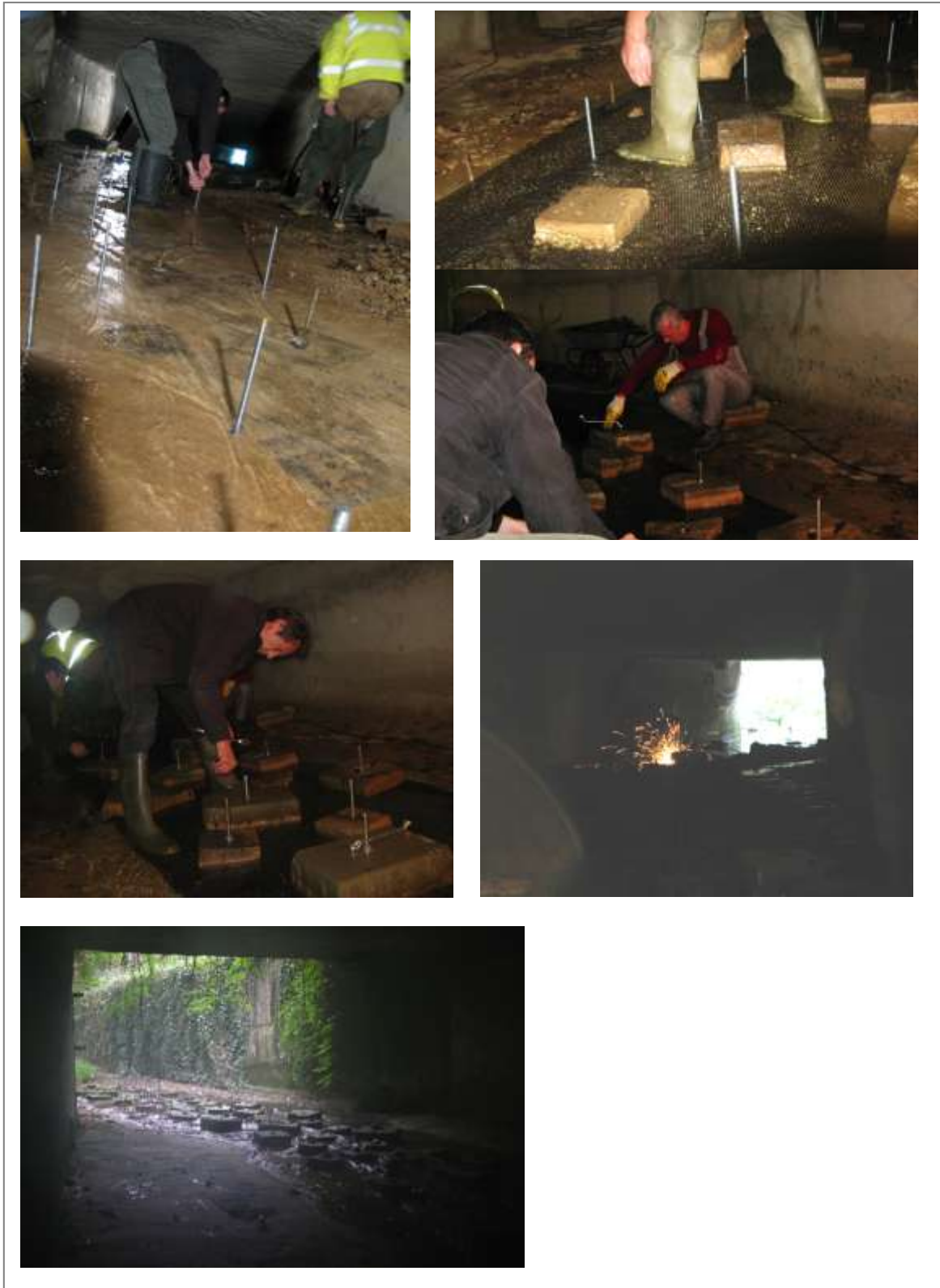
Arbeitsschritte am Erlenbach