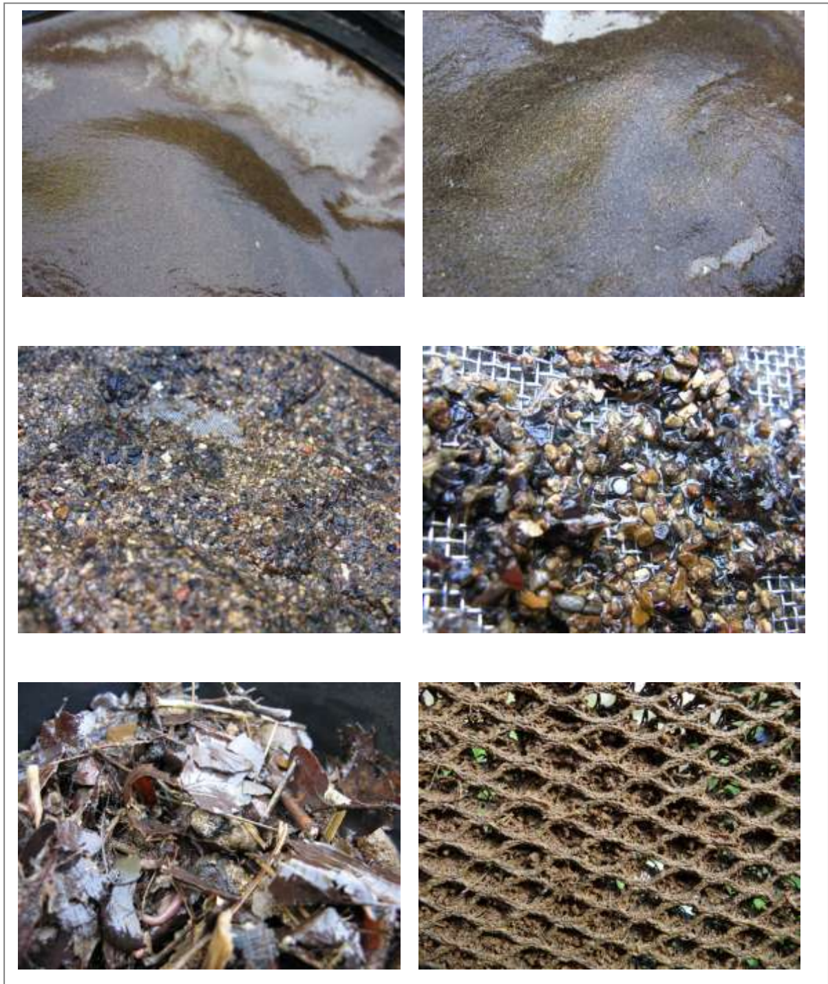
Abbildung 8: Sediment der Probe im April 2011 sortiert nach Maschengröße. Von oben links: 0,071 mm, 0,125 mm, 0,25 mm, 1,7 mm und 3,85 mm. Unten rechts: das beprobte 30 cm x 30 cm Gewebestück.