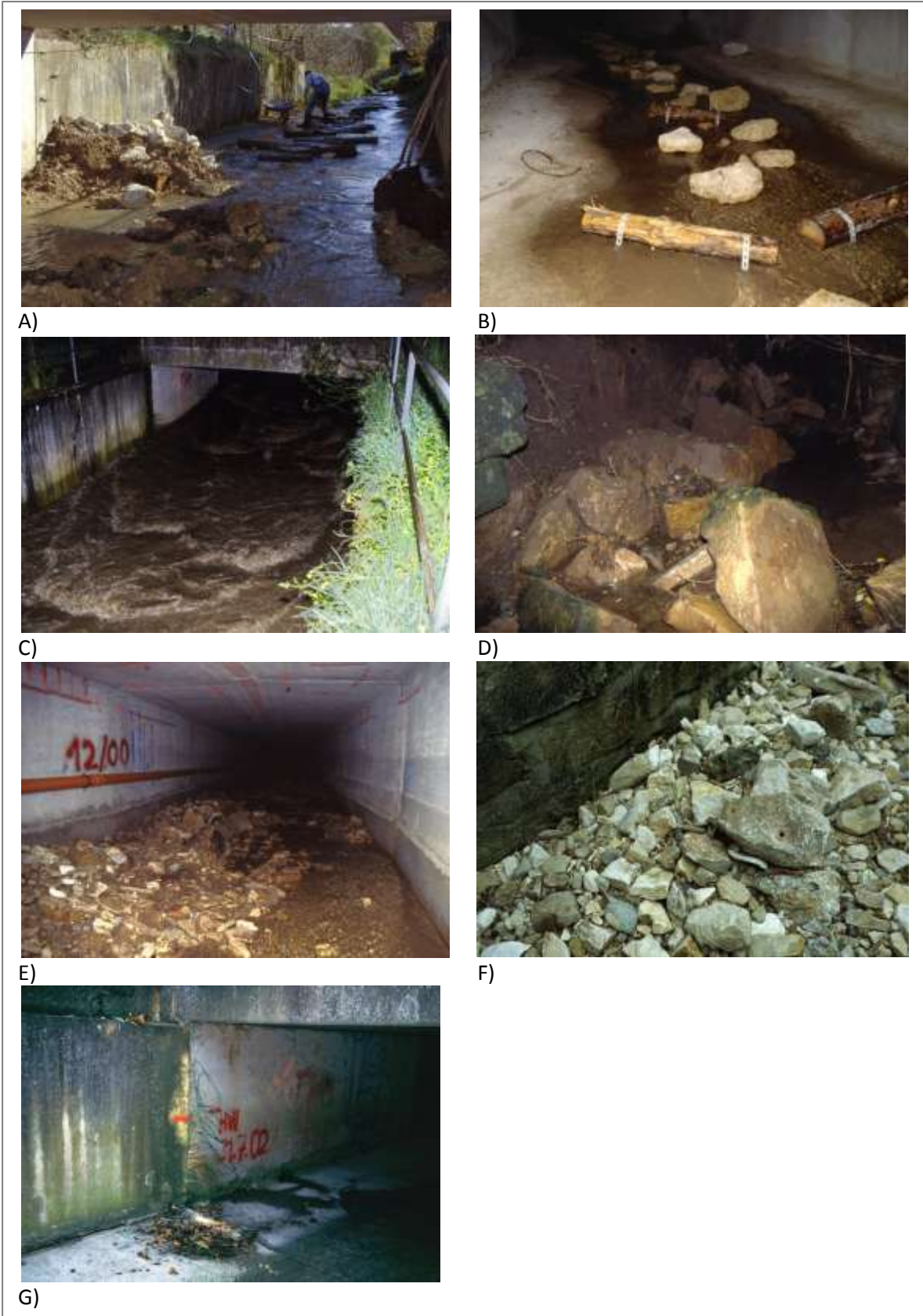
Abbildung 1: Einbau von Störsteinen im Erlenbach durch den Arbeitskreis lebendiger Neckar 1999 (A). Die Störsteine in der Verdolung (B). Das Hochwasser von 2002 (C) zeigte das eine stabilere Verdübelung notwendig war; sämtliche Steine waren ausgerissen (D; E; F) Hochwassermarkierung (G).