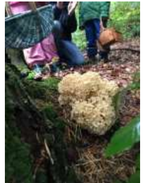
Krause Glucke, W. Wagner